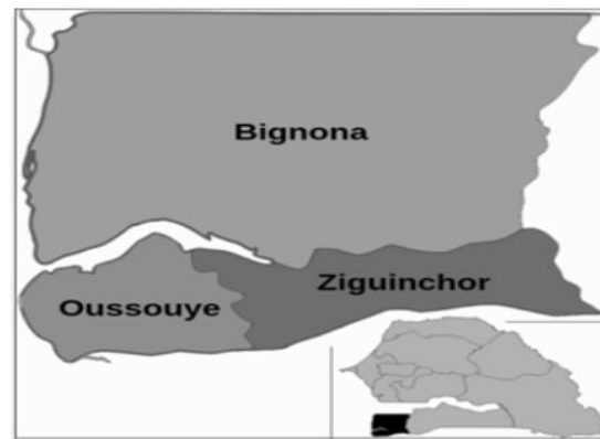
Figure 5 : Localités Bignona, Oussouye et Ziguinchor (région de Casamance)