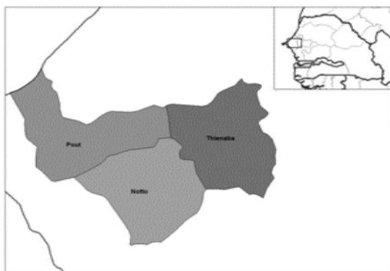
Figure 4 : Localité de Pout (région de Thiès)

La Casamance est une partie du Sénégal qui couvre une superficie totale de 52 000 km 2 dont le seul relief est représenté par les contreforts du Fouta Djallon au sud-est du territoire. Elle est limitée à l'Est par le Mali à l'Ouest par l'océan Atlantique, au Nord par la Gambie et au Sud par la Guinée-Bissau et la Guinée Conakry ( Figure 5 ). Dans cette région nous avons échantillonné au niveau des départements de Bignona, Ziguinchor et Oussouye qui constituent les zones les plus productives de fruits au Sénégal. Dans le département de Bignona notre échantillonnage est réalisé dans la localité de Diatock : latitude 14° 45' 43 Nord, longitude 17° 17' 57 Ouest et altitude de 17 m de la mer. Dans le département de Ziguinchor, l'échantillonnage a lieu dans la localité de Tobor : latitude de 12° 41' 23 Nord et longitude 16° 23' 07 Ouest et altitude de 31 m de la mer. Enfin, dans le département d'Oussouye, c'est la localité de Loudia wolof qui est choisie : latitude de 12° 39' 59 Nord de longitude 16° 15' 26 Ouest et altitude de 40 m de la mer. Le climat de la région est de type soudano- guinéen caractérisé par une période humide correspondant aux mois de juin à octobre (été) mais appelée ici saison des pluies ou hivernage. La pluviométrie varie entre 800 à 2000 mm d'est en ouest. La température est sensiblement égale dans les différentes zones étudiées et tourne autour de 30°C (29,8 °C à Bignona et 30,1 °C à Ziguinchor et Oussouye).